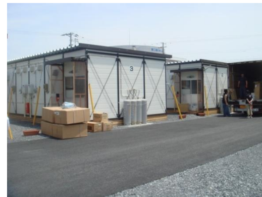
Logement provisoire à Ishimaki