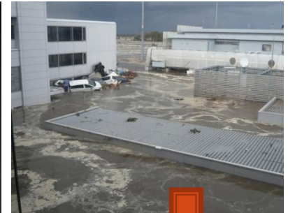
Aéroport de Sendai