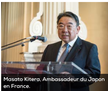
Masato Kitera, Ambassadeur du Japon en France.

En parallèle, et pour favoriser l'apprentissage de la culture nipponne, l'Université de Strasbourg crée, en 1986, un département d'études japonaises promis à un bel avenir. En 2001, le Centre Européen d'Études Japonaises d'Alsace (CEEJA) est créé, dans le but de « promouvoir et de développer les contacts économiques avec le Japon et l'apprentissage de la langue et de la culture japonaises ».