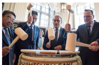
« Kagami biraki » au Palais Rohan : l'ouverture d'un tonneau de saké avec des maillets a, dans la tradition japonaise, placé la célébration du 25 e anniversaire sous les meilleurs auspices.