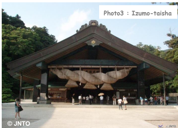
Photo3 : Izumo-taisha