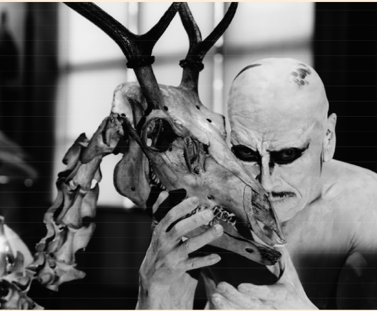
Photo pour La Planète des Insectes : Nobuyoshi Araki à l'Intermediatheque