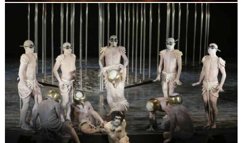
La planète des insectes, © Hiroyuki Kawashima