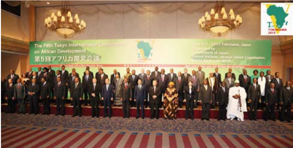
Séance photo lors de la cérémonie d'ouverture

La cinquième édition de la Conférence internationale de Tokyo sur le développement de l'Afrique (TICAD V) s'est tenue du 1er au 3 juin à Yokohama au Japon. Elle a lieu tous les cinq ans depuis 1993, année de sa création, et réunit des chefs d'Etat et de gouvernement des pays africains, mais également de nombreux autres participants.