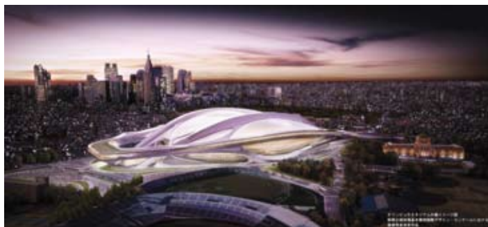
Tokyo 2020 disposera d'un Stade Olympique futuriste

La pièce maîtresse sera le nouveau Stade Olympique – le premier stade de l'histoire des Jeux doté d'un toit rétractable. Ce stade de 80 000 places sera prêt en mars 2019, à temps pour accueillir les matchs de la Coupe du Monde de Rugby 2019. Il mêlera l'histoire et la tradition du lieu avec l'expertise de Tokyo en matière d'innovation et de technologie, créant un nouveau lieu emblématique pour le sport à l'échelle nationale et internationale. Il accueillera les Cérémonies