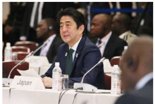
Intervention de M. ABE lors de la 3ème session plénière

Quatre jours après la clôture de la TICAD V, lors du sommet bilatéral entre le Japon et la France qui a eu lieu le 7 juin à l'occasion de la visite d'Etat au Japon de M. François HOLLANDE, les deux dirigeants, se félicitant des résultats positifs de la TICAD V, se sont mis d'accord sur le fait que les deux pays portent ces résultats, importants pour l'avenir de l'Afrique, au coeur de l'attention du sommet du G8 de Lough Erne. Ils ont également mentionné, dans le « Communiqué conjoint », que leurs agences de développement (à savoir l'AFD et la JICA, Agence japonaise de coopération internationale) mèneront une coopération en matière de sécurité alimentaire en Afrique, notamment un projet conjoint pour faciliter la production rizicole dans la vallée du fleuve Sénégal.