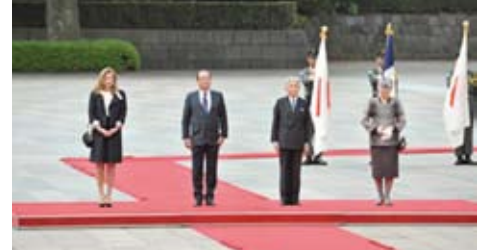
Cérémonie officielle au Palais impérial

Cette visite d'État a été pour le Japon l'occasion de jeter les bases d'une véritable relation de coopération avec le gouvernement français, d'autant plus que le Président HOLLANDE s'était, lors de son arrivée au pouvoir en mai 2012, engagé à se rapprocher du Japon. La conférence au sommet et la publication des communiqués conjoints qui s'en est suivie ont permis d'approfondir de manière concrète le « partenariat d'exception » entre la France et le Japon, celui-ci reposant sur le partage de valeurs, intérêts et devoirs communs. Afin de véritablement tirer profit cette opportunité, il est désormais essentiel de mettre en œuvre les décisions prises dans les communiqués conjoints.