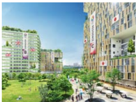
Le Village Olympique sera situé au cœur de la ville

Chacun pourra profiter d'installations compactes et performantes, pensées autour d'un Village Olympique situé sur la Baie de Tokyo. Les résidents du Village seront en plein cœur de la ville, à quelques minutes à pied seulement des lieux culturels, des restaurants et des commerces de Ginza, l'une des destinations touristiques les plus connues et les plus appréciées de Tokyo. Le Village olympique sera le centre géographique, opérationnel et spirituel des Jeux. Il