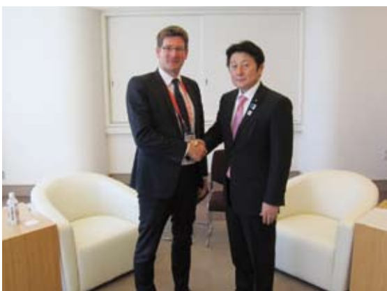
Conférence entre MM. CANFIN et MATSUYAMA

Avec pour thème majeur « Main dans la main avec une Afrique plus dynamique », la TICAD V s'est structurée autour de trois sujets principaux : « une économie solide et durable », « une société inclusive et résiliente » et « paix et stabilité » dans le but de discuter de l'orientation du développement africain de manière fructueuse.