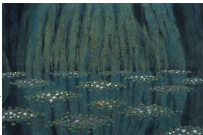
Claude Monet (1840-1926), Nymphéas avec rameaux de saule vers 1916-1919