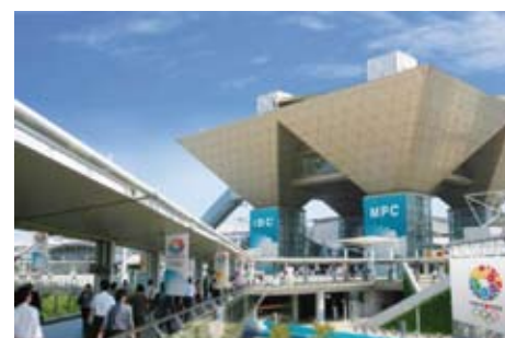
Les médias seront installés au Tokyo Big Sight

Les compétitions se dérouleront dans trois types de sites. Premièrement, les sites historiques datant des Jeux de 1964 seront modernisés et rénovés pour prolonger leur héritage d'au moins 50 années supplémentaires. Parmi ces sites qui bénéficieront d'une modernisation se trouve le Stade National de Yoyogi qui accueillera les compétitions de handball. Deuxièmement, de nouveaux sites permanents, symboles d'un héritage