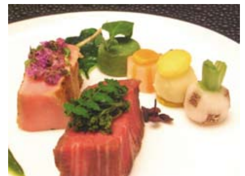
Filets de bœuf du Limousin et de Kobé

La viande de veau du Limousin a pu être importée au Japon grâce aux efforts de l'entreprise Nichirei. Ce projet a pu être mené à bien grâce à l'aide de l'entreprise Nichirei, dont les efforts ont permis l'importation au Japon de la viande de veau du Limousin ; il est à noter que les autorités japonaises ont levé en février dernier l'embargo portant sur les viandes de veau françaises.