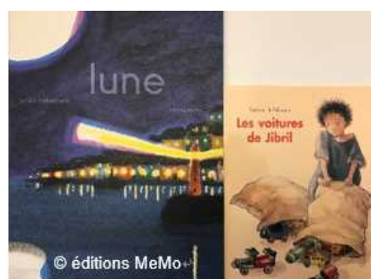
LES VOITURES DE JIBRIL, de Satomi Ichikawa, © 2011, l'école des loisirs, Paris

Il y a énormément de formidables œuvres d'auteurs japonais vivant en France comme par exemple : Les voitures de Jibril de ICHIKAWA Satomi dont le protagoniste, Jibril, vit dans le désert ; Lune de NAKAMURA Junko, qui ressemble à une véritable collection de peintures ; Momoko de Kotimi, relatant l'enfance de l'auteure pendant l'ère Showa ; Iris et l'escalier avec les douces illustrations de MIYAMOTO Chiaki ; ou encore Regarde dans la jungle par HAYASHI Emiri, avec d'adorables animaux pour les tout-petits.