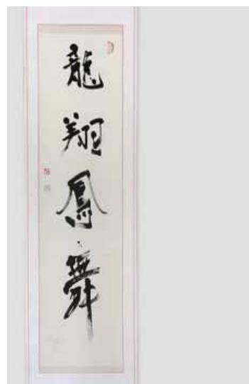
© Maaya Wakasugi Comme le vol vigoureux du dragon, comme la danse gracieuse du phénix

Malgré tout, ses productions ne sont pas des peintures mais bien de la calligraphie. Comme il le faisait pendant son enfance, Maaya ne cesse de pratiquer et d'étudier tous les jours grâce à des recueils de calligraphie classique. La calligraphie japonaise et la calligraphie occidentale sont parfois comparées mais au Japon il ne s'agit pas uniquement d'écrire de jolis caractères. Les espaces vides sur le papier, le flou de l'encre ou encore l'élan du coup de pinceau sont autant d'éléments fondamentaux dans la réalisation de cet art que l'on retrouve dans le travail de Maaya.