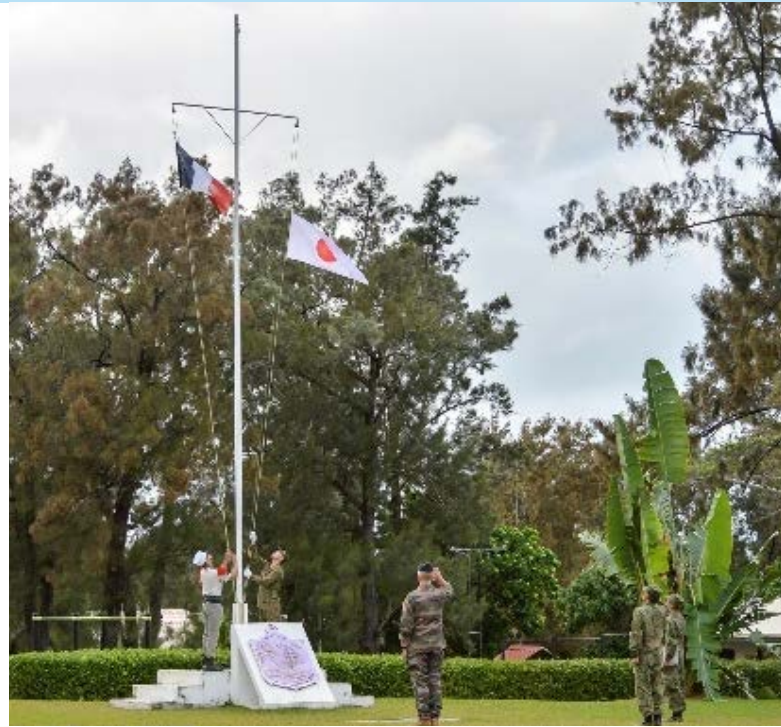
© Japan Maritime Self Defense Force (JMSDF)