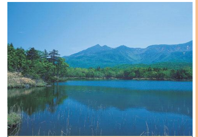
Photo5: La péninsule de Shiretoko

véritable rotenburo naturel. Il m'est difficile d'exprimer avec des mots la beauté de l'endroit, mais je vous invite à vous y rendre si vous êtes intéressés. Sachez également que l'accès à la Cascade de Kamuiwakka