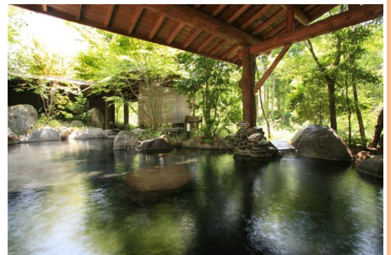
Photo3: Un « rotenburo » de Kurokawa-onsen (été)

L'autre endroit est la « Cascade de Kamuiwakka » située sur la péninsule de Shiretoko , au Hokkaidō – comme vous le savez sans doute, la péninsule de Shiretoko a été inscrite en juillet 2005 au Patrimoine mondiale de l'UNESCO. Véritable cascade d'eau chaude, la cascade de Kamuiwakka se forme lorsque les sources chaudes qui jaillissent des pentes du Mont Iō, un volcan actif, se jettent dans la rivière Kamuiwakka. Comme vous pouvez le voir sur la photo, cette véritable source chaude naturelle et sauvage est très différente des sources de la station de Kurokawa que j'ai présentées un peu plus haut.