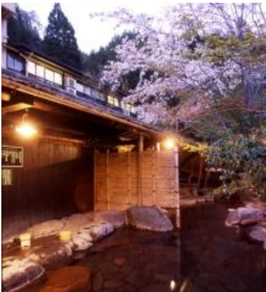
Photo1: Un « rotenburo » de Kurokawa-onsen (printemps)

Les onsen sont des lieux de détente et de relaxation. Ils proposent souvent, en plus du bain lui-même, des possibilités d'hébergement et de restauration.