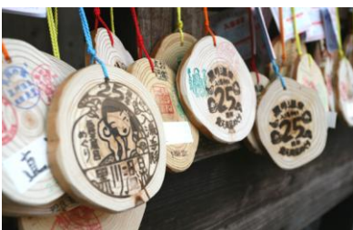
Photo2: « bon d'entrée » (Nyuyoku-tegata) de Kurokawa

L'autre endroit est la « Cascade de Kamuiwakka » située sur la péninsule de Shiretoko , au Hokkaidō – comme vous le savez sans doute, la péninsule de Shiretoko a été inscrite en juillet 2005 au Patrimoine mondiale de l'UNESCO. Véritable cascade d'eau chaude, la cascade de Kamuiwakka se forme lorsque les sources chaudes qui jaillissent des pentes du Mont Iō, un volcan actif, se jettent dans la rivière Kamuiwakka. Comme vous pouvez le voir sur la photo, cette véritable source chaude naturelle et sauvage est très différente des sources de la station de Kurokawa que j'ai présentées un peu plus haut.