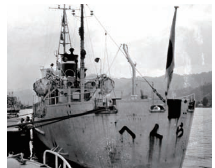
► Patrouilleur des Garde-côtes du Japon ayant essuyé des tirs de la République de Corée près de Takeshima en juillet 1953

Tracée unilatéralement par la RDC en violation du droit international