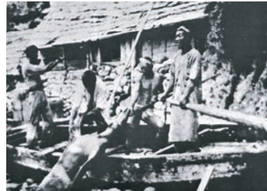
▲ La Société de pêche de Takeshima vers 1909

► Les pêcheurs japonais menaient des activités de pêche florissantes à Takeshima et dans les eaux environnantes (années 30)